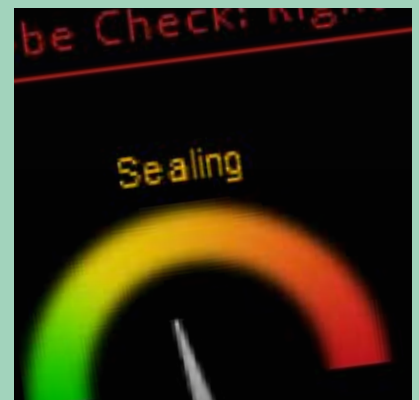
Comprobación de sellado