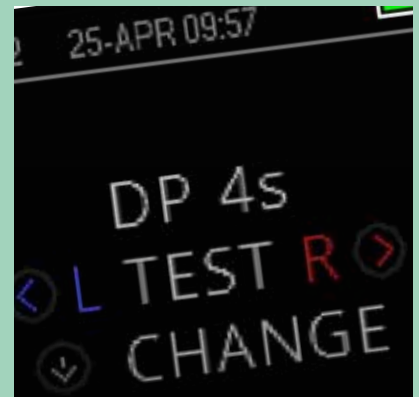
Selección de prueba

Con una capacidad de almacenamiento interno de 500 pruebas, no tendrá que preocuparse de que se agote el espacio en su OtoRead™.